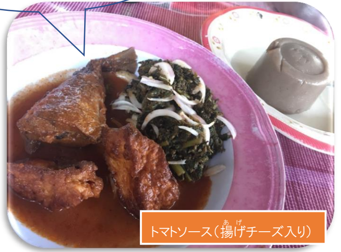
トマトソース(揚げチーズ入り)

『パット』に『クレクレ』というモロヘイヤソースまたは『トマトソース』と一緒に食べることがベナン式！